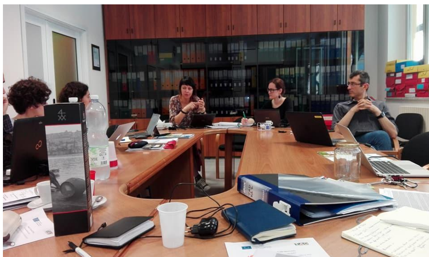
Nuotrauka: Projekto partnerių susitikimas, Turinas, Italija.

Pirmasis projekto rezultatas – visiems prieinamo turizmo paslaugų apžvalgos ataskaita. Susitikimo metu projekto partneriai aptarė baigiamuosius šio dokumento pristatymo darbus bei jo sklaidos planą. Projekto viešinimą koordinuoja vienas projekto partnerių – European Network for Accessible Tourism ASBL (ENAT).